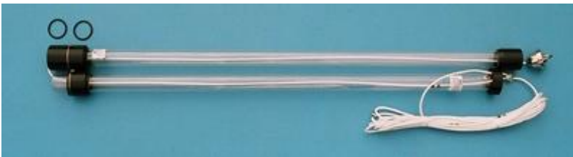
10.200- 采样管 A+采样管 B, 2L