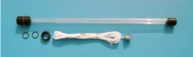
10.100- 采样管 A, 1L